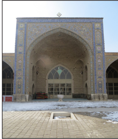
تصویر ۲. ایوان جنوبی مسجد.

این سنگاب مدور بسیار بزرگ و زیبا که از سنگ یکپارچه پارسی تراشیده شده و متصل به سنگ پایه‌ای چهارگوش است، در زیر ایوان جنوبی مسجد نصب شده است (تصویر ۲).