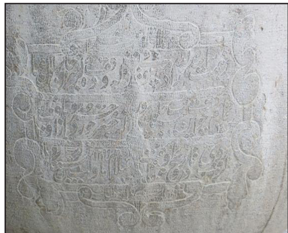
تصویر ۶. کتیبه سوم سنگاب.

است. به عبارت دیگر مستوفی نقش حسابدار کل را ایفا