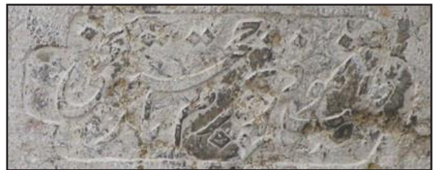
تصویر ۵. مطلع و مقطع شعر کتیبه دوم.