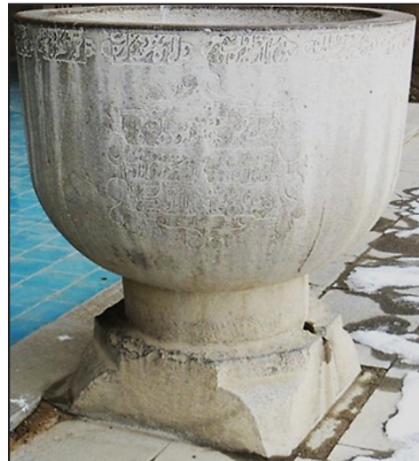
تصویر ۳. سنگاب مسجد رحیم خان (عکس از: نگارنده).