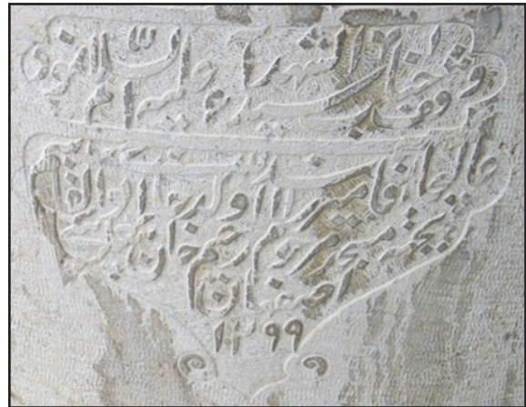
تصویر ۹. کتیبه چهارم متن وقف‌نامه سگاب

- افضل طوسی، غفت‌السادات و مریم پورحسن. (۱۳۹۱). «نقش نمادهای آئینی و دینی در نشانه‌های بصری گرافیک معاصر ایران». در فصلنامه مطالعات ملی ، ش ۴۹ (سال سیزدهم، شماره ۱)، ص ۱۲۶-۱۶۱. - افضل طوسی، غفت‌السادات و نسیم مانی. (۱۳۹۲). «سنگاب‌های اصفهان، هنر قدسی شیعه». در فصلنامه علمی پژوهشی هنر معماری و شهرسازی نظر ، سال دهم، ش ۲۷، ص ۴۹-۶۰. - انوری، حسن. (۱۳۸۲). فرهنگ فشرده سخن . تهران: سخن. - بیهقی، ابوالفضل محمد بن حسین. (۱۳۸۵). تاریخ بیهقی . به کوشش