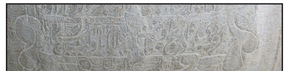
تصویر ۷. مطلع و مقطع شعر کتیبه.