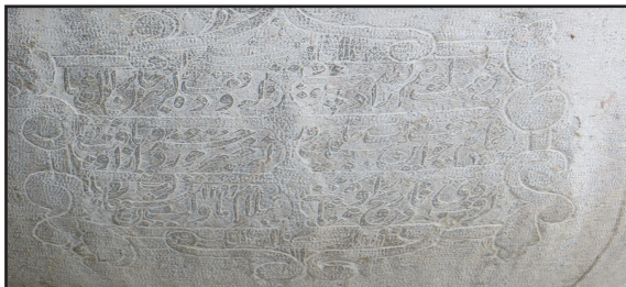
تصویر ۸. مصرع آخر.

در این کتیبه شاعر از اسدالله با عنوان مستوفی یاد