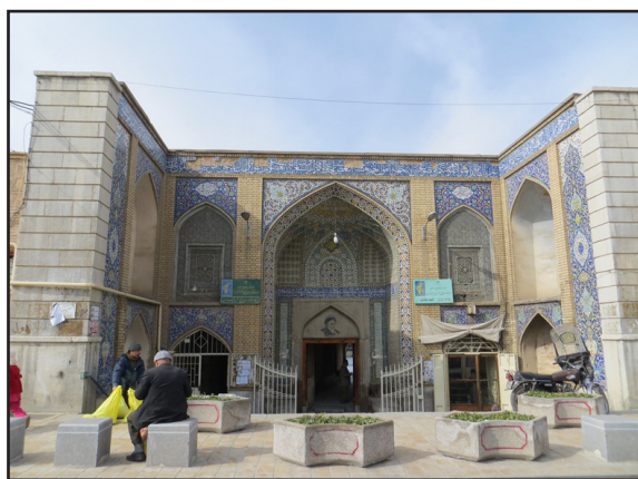
تصویر ۱. ورودی مسجد رحیم‌خان (عکس از: نگارنده).

در مسجد رحیم‌خان تاریخ‌های مختلفی چون سال ۱۲۹۰ق مکتوب بر کتیبه ستون سنگی آن، سال ۱۲۹۵ق بر سقف ایوان، سال ۱۲۹۵ق و ۱۳۰۱ق در کتیبه سردر شرقی، سال ۱۳۰۴ق در کتیبه نمای خارجی ایوان جنوبی و کتیبه فوقانی محراب مسجد، سال ۱۲۹۹ق بر سنگاب آن، و تاریخ ۱۳۷۸ق در دو پشت‌بغل غرفه وسط ضلع شمالی صحن مسجد دیده می‌شود (هنرفر، ۱۳۵۰: ۷۹۶). در این مسجد بیش از پانزده کتیبه وجود دارد که هر یک به زیبایی بنا افزوده و بیانگر هنر کاتب و کاشیکار آن هستند. در کنار زیبایی‌های مسجد رحیم‌خان سنگاب بزرگ و مدور آن با چهار کتیبه جلب توجه می‌کند (تصویر ۲).