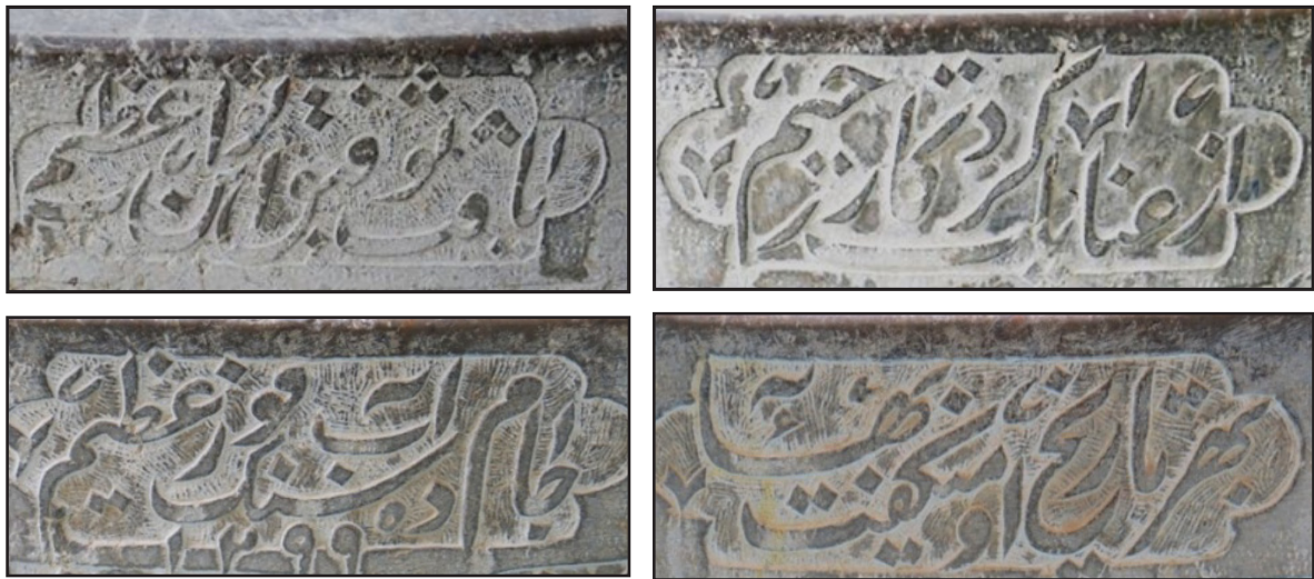
تصویر ۴. مطلع و مقطع شعر کتیبه اول